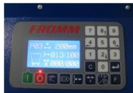
Lehce ovladatelný řídicí panel

Napájení: 115 / 230V - 50 / 60Hz Velikosti polštářů: 120 – 400 mm programovatelné Šířka filmu: 210 mm Tloušťka filmu: 25my - 50my Kvalita filmu: PE nízké a vysoké hustoty Složený film / ne trubice