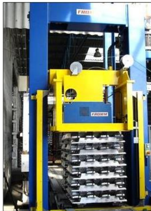
Stroj aplikuje automaticky 2 nebo 3 pásy