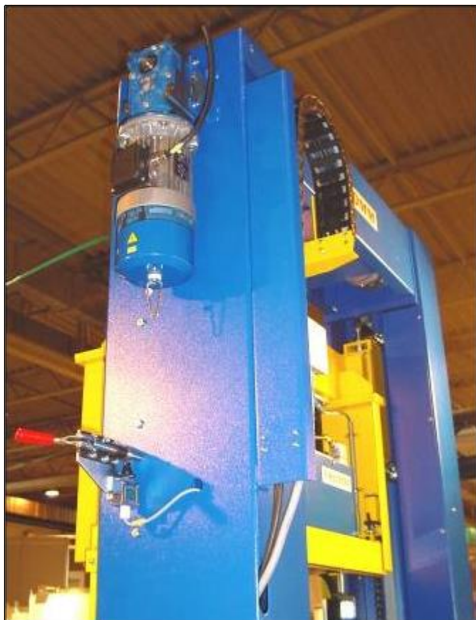
Robust, 2 columns construction including drive motor and service safety device