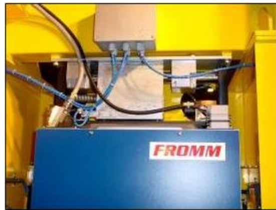
FROMM páskovací hlava model MH600 na vysoké napnutí a frikční svar; zavěšení hlavy s „plovoucím“ systémem