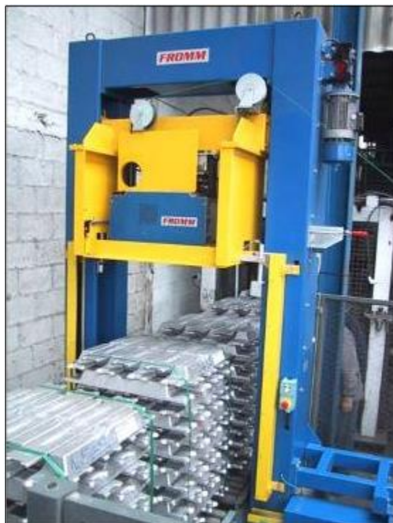
Balík je v pevné pozici