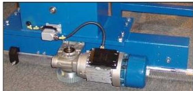
Sword including sword case on lateral sled including energy chains. Rack and pinion drive for accurate Positioning of the machine