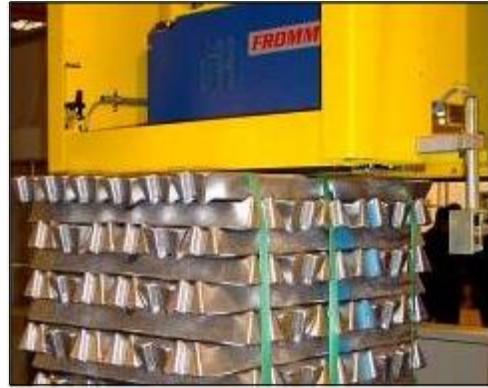
Dvojitý lis stlačující ingotovou vrstvu na obou stranách páskovací linky